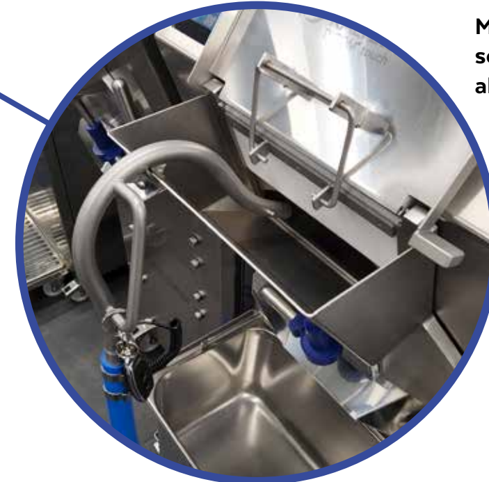
Mit dem Edelstahl-Einfüllbogen schnell und sauber umfüllen oder absaugen