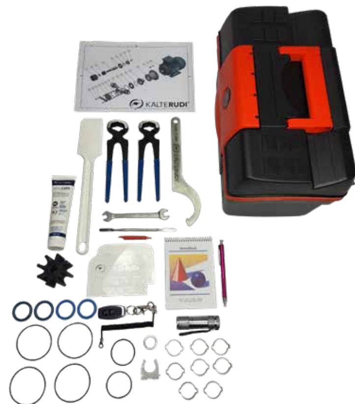
Care & Clean-Kit

Erleben Sie die nächste Generation der Transfer-Pumpen für das Eislabor. Mehr Komfort, höchste Hygiene und ein Maximum an Flexibilität – genau das, was Ihre Produktion braucht.