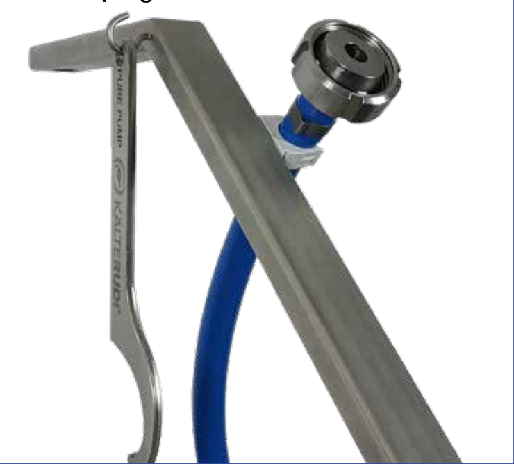
Smarte Halterung für Schläuche direkt am Pumpengehäuse