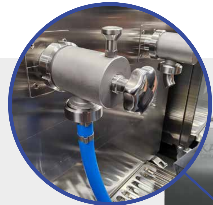
Der neue KÄLTE RUDI Sicherheitshahn, serienmäßig mit DN32 Gewindeanschluss